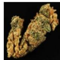
▲ Alerte: cannabi... 5F-MDMB-PICA 06.10.2020