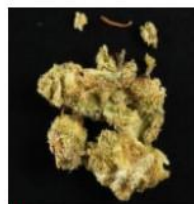
▲ Alerte: Cannabi... 5CI-ADB-A 10.07.2020

Le cannabis actuellement vendu sur le marché illégal en Suisse contient régulièrement des cannabinoïdes synthétiques qui peuvent mener à une surdose mortelle. Il est impossible de le différencier à l'œil, à l'odeur ou au goût d'un cannabis à haut taux de THC.