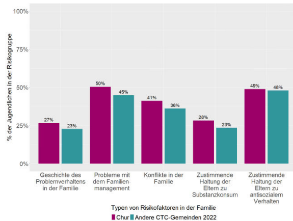
Abbildung 5.1 Risikofaktoren im Bereich Familie