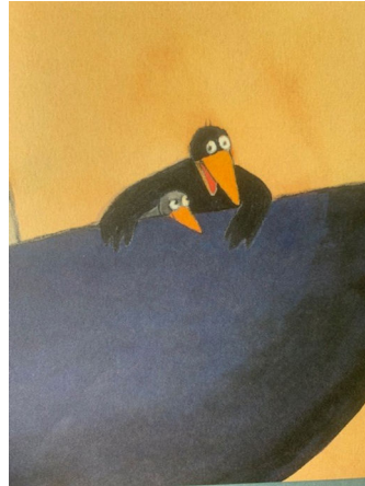
Schreimutter